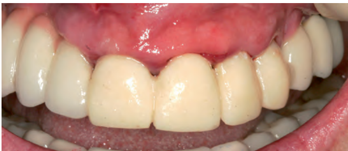
Рис. 6. После установки временных коронок. Обратите внимание, десна вокруг временных коронок изменила цвет с синюшной до ярко-розовой