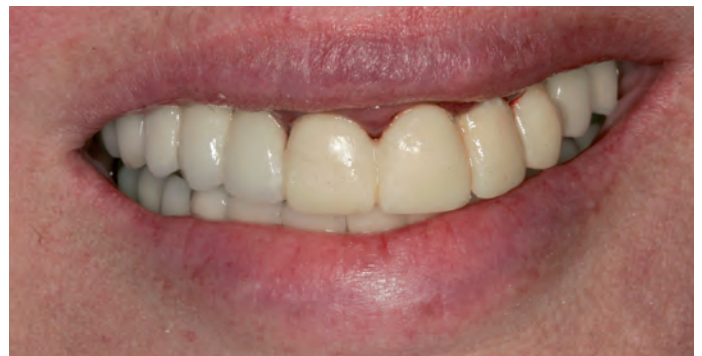
Рис. 7. Улыбка через 1,5 часа после начала лечения

был установлен универсальный имплантат ИМПРО Имплантом. Установку имплантата рекомендуется проводить машинным имплантоводом с усилием 50 Нсм. Высокая точность изготовления и отсутствие люфта имплантовода в имплантате, позволяют ввести даже самый тонкий имплантат с усилием 50Нсм без риска повреждения антиротационного шестигранника внутри имплантата. При необходимости имплантата докручивается с помощью храпового ключа.