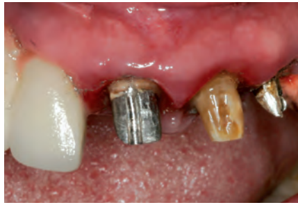
Рис. 2. После снятия коронок. Подвижность зубов 2–3 степени