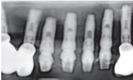
Рис. 5. Фрагмент ОПГ после установки имплантатов и фиксации временных абатментов