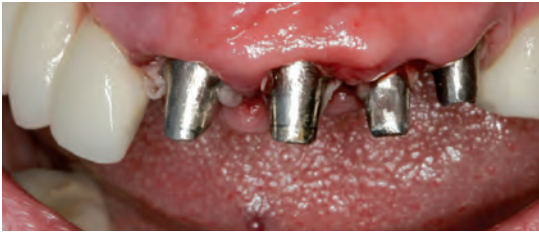
Рис. 4. После установки имплантатов и фиксации временных абатментов