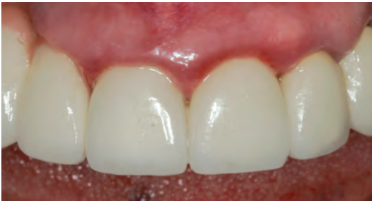
Рис. 1. До лечения. Обратите внимание на посинение десны вокруг коронок